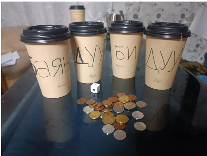
Зураг 1. Шоо орхиж аяганд зоос хуваарилах тоглоомын хэрэгслүүд 5

бүрийн тоогоор 1000 төгрөгийг тооцоолж тухайн хүнд өгөх юм. Үүний дараа энэ тоглоом амьдрал дээр болдог юуг санагдуулж байгаа, энэ судалгааг юу гэж бодож байна вэ гэсэн хоёр асуултыг асууж товч хариулт авна.