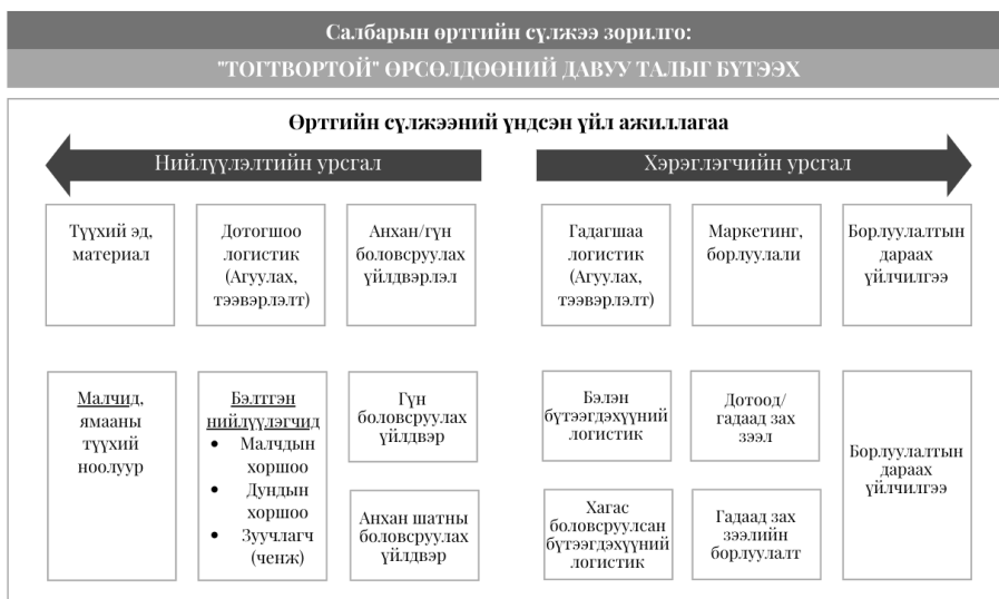
Зураг 1. Монгол улсын ноолуурын өртгийн сүлжээний зураглал

Өртгийн сүлжээ нь компани зах зээлд урт хугацааны тогтвортой өрсөлдөөний давуу талыг бүтээх, хадгалах зорилготой. Өртгийн сүлжээ гэх ойлголтыг анх М.Портер нэвтрүүлсэн бөгөөд салбар эсвэл ихэвчлэн компани орцыг гарц болгох үйл явцад нэмүү өртөг хэрхэн бүтээж буйг задлан шинжилдэг. Өртгийн сүлжээний үйл ажиллагааг үндсэн болон дэмжих гэж хуваан үздэг (Зураг 1). Монгол улсын ноолуурын өртгийн сүлжээг өнөөгийн нөхцөл байдалд үндэслэн дараах зураглалыг гаргав.