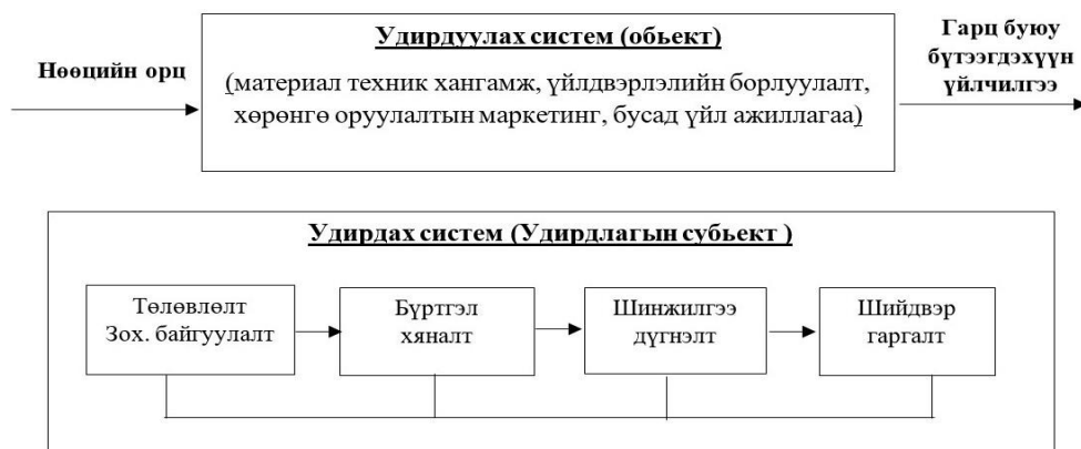
Дүрслэл 1. ЭЗШ-ний удирдлагын системд эзэлж буй байр суурь

Удирдлагын систем нь удирдуулах (управляемая) систем буюу удирдлагын объект, удирдах (управляющая) систем буюу удирдлагын субъектаас бүрэлдэнэ. Эдийн засгийн шинжилгээний удирдлагын системд эзэлж буй байр суурийг нэмэгдүүлэх бодит шаардлага байна.