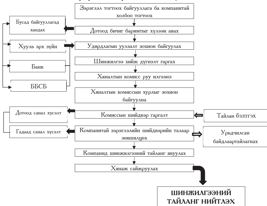
График 2. Зэрэглэл тогтоох үе шат